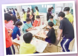
▶それぞれの色にそれぞれの思い出。

1枚750円で生徒210名と教員30名分の合計240枚作成。来年度はPTA役員分も作成予定。