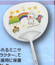
▶うちわはカバンに入れられるミニサイズの物で手稲区のキャラクター、いぬ君。500枚作って、応援用に保護者のみなさまにお配りしました。