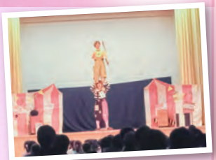
▲双子パフォーマーPLutoさんの演技に時間を忘れて、いつもの体育館に歓声と拍手が響きました。

無いため学習発表会に役立つと考え、今年度は「星の王子さま」を観劇。子どもたちは真剣に観ていて、演技の仕方や工夫などを感じ取っていました。