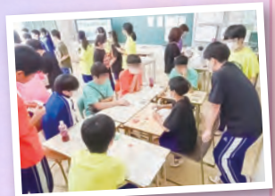
▶それぞれの色にそれぞれの思い出。

1枚750円で生徒210名と教員30名分の合計240枚作成。来年度はPTA役員分も作成予定。