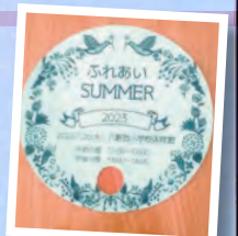
▲児童と保護者に配布したうちわ。暑さ対策だけでなくプログラム役劇も。

とご家族が参加しました。夏休み初日のとても暑い日でしたが、サポーターのみなさまのお陰で体調不良者を出すこともなく無事に終了。事後アンケートでは「子ども達が楽しんでいた」「当日のみの参加でもできることが良かった」等の沢山の感想を頂きました。