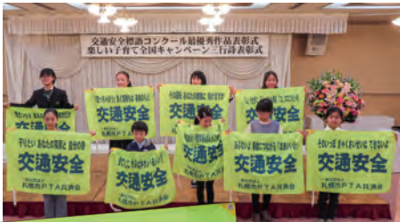
▲交通安全標語 コンクール

このように共済給付事業だけでなく、子どもたちの安全を守る事業にも力を入れています。今後とも一般社団法人札幌市PTA共済会をよろしく願っています。