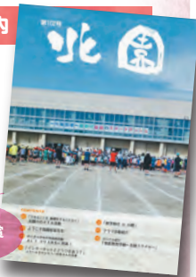
第42回 教育長賞最優秀賞 北国小学校 「北国」

※なお、新型コロナウイルス感染症の流行状況により、開催変更の可能性がございますので、ご了承ください。